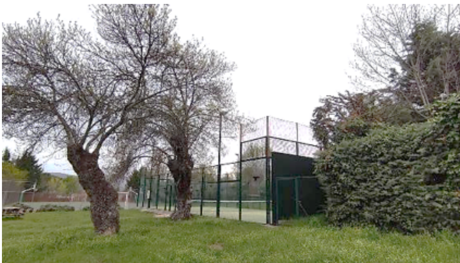
Pistas de pádel en Lozoya (Madrid) el 28 de abril de 2022.