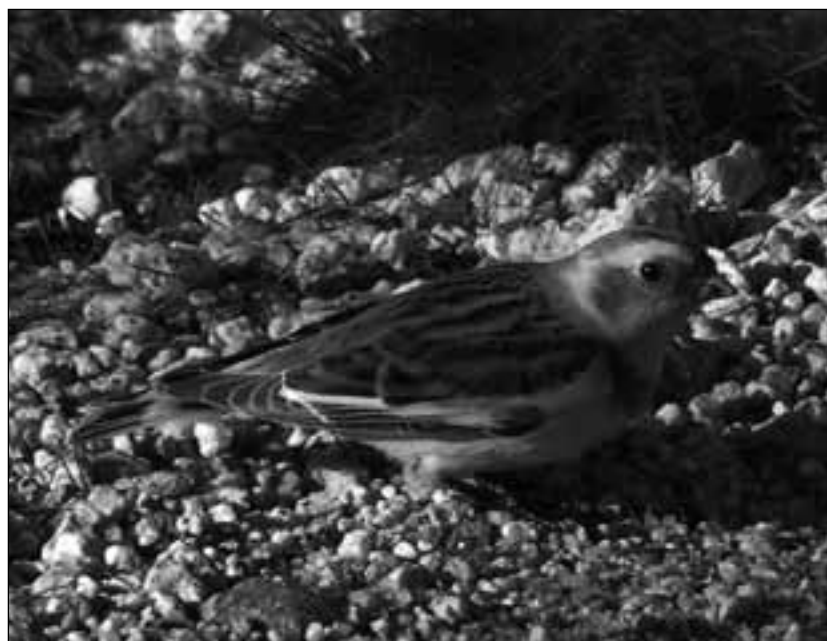
Escribano nival ( Plectrophenax nivalis ) en Colmenar Viejo el 16 de diciembre de 2008.