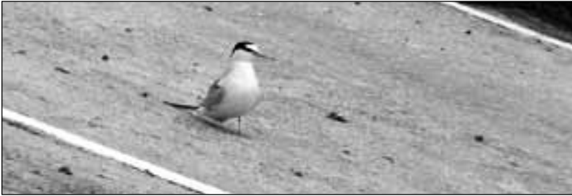
Charrancito común ( Sterna albifrons ) adulto en el parque Juan Carlos I (Madrid) el 24 de mayo de 2008 (foto: Manuel Chapa).