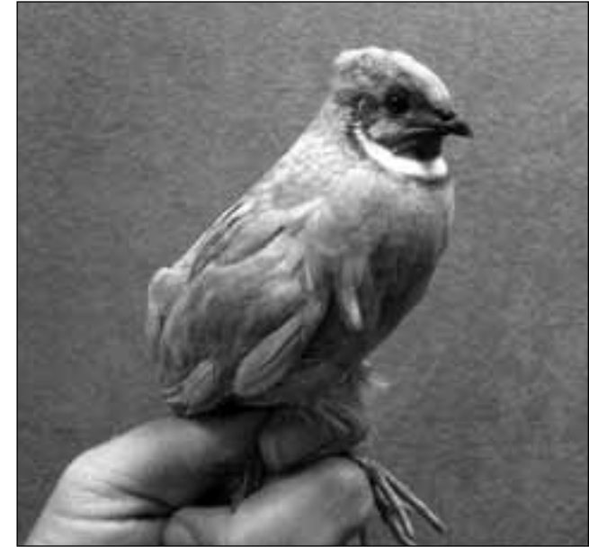
Codorniz china ( Coturnix chinensis ) fotografiada en el local de SEO/BirdLife en Madrid el 24 de junio de 2008.