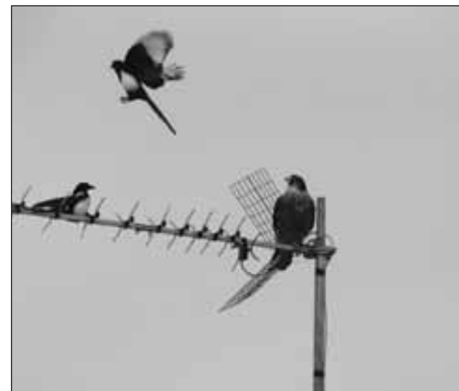
Halcón peregrino ( Falco peregrinus ) en la urbanización El Bosque (Villaviciosa de Odón) el 23 de septiembre de 2005.

Estatus provincial: A, con una única cita en 1996.