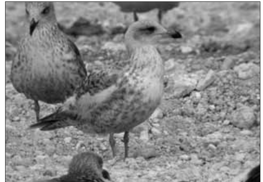
Gaviota argétea europea ( Larus argentatus ) de primer invierno en el vertedero de Colmenar Viejo el 8 de septiembre de 2008 y otro ejemplar de primer invierno en el vertedero de Pinto el 6 de abril de 2008.