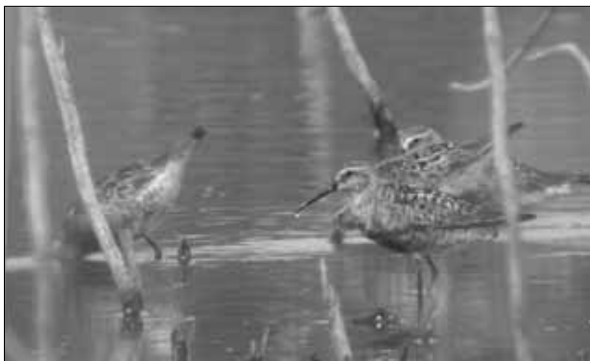
Correlimos zarapitines ( Calidris ferruginea ) en el embalse de Pedrezuela (Guadalix de la Sierra) el 13 de agosto de 2007.