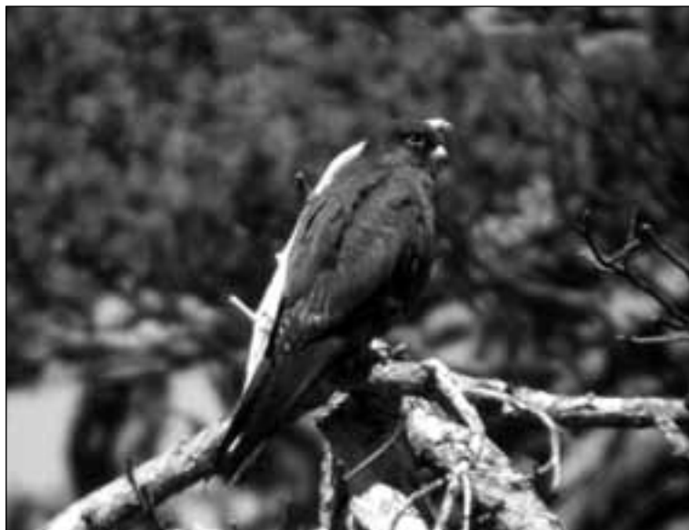
Ejemplar de halcón de Eleonora ( Falco eleonora ) de fase oscura en Cabeza Mediana (Rascafría) el 8 de agosto de 2007.