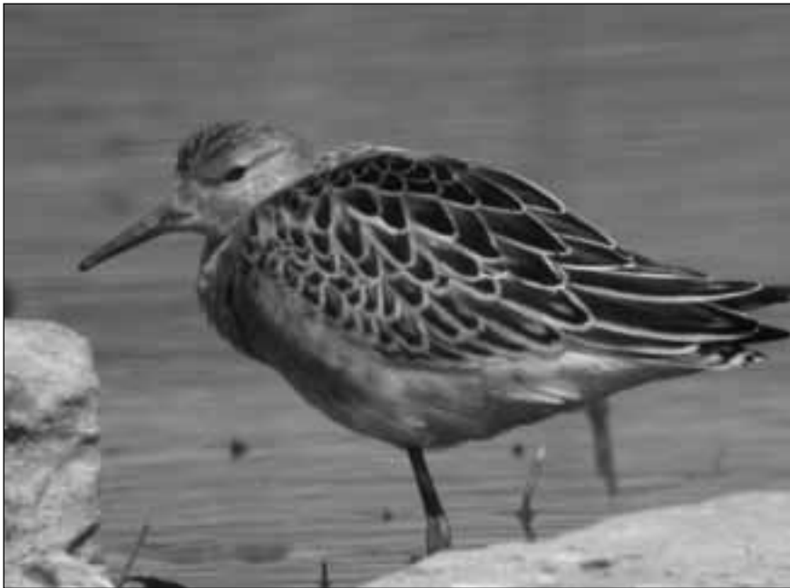
Combatiente ( Philomachus pugnax ) joven en el embalse de Pedrezuela (Guadalix de la Sierra) el 28 de septiembre de 2007.

Criterio: todas las citas recibidas. Para información detallada acerca de la fenología y distribución de la especie