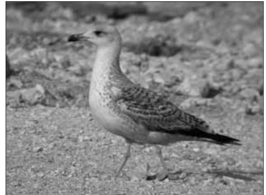
Gaviota patiamarilla ( Larus michahellis ) adulta en el vertedero de Colmenar Viejo el 7 de septiembre de 2008 y otro ejemplar en el vertedero de Pinto el 6 de abril de 2008.