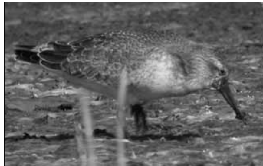
Correlimos gordo ( Calidris canutus ) joven en el embalse de Pedrezuela (Guadalupe de la Sierra) el 3 de septiembre de 2007.

mucho entre sí, ya que en ciertas condiciones resulta complicado identificarlos a nivel específico. Sin citas recibidas.