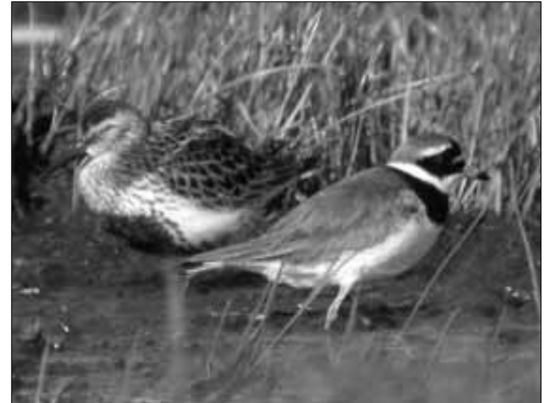
Chorlitejo grande ( Charadrius hiaticula ) y correlimos común ( Calidris alpina ) en el embalse de Santillana (Manzanares el Real) el 14 de mayo de 2007.

Criterio : todas las citas recibidas. Es importante prestar especial atención a los jóvenes de chorlitejo que se parecen