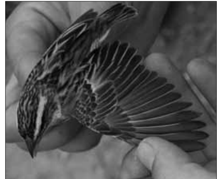
Tejedor amarillo ( Euplectes afer ) hembra capturada para anillamiento en el carrizal de Los Albardales (San Martín de la Vega) el 29 de septiembre de 2007.