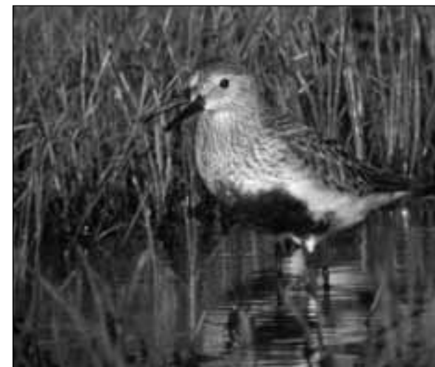
Correlimos común ( Calidris alpina ) en plumaje estival en el embalse de Pedrezuela (Guadalix de la Sierra) el 16 de mayo de 2007.