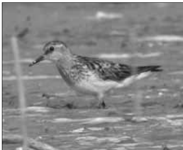
Correlimos menudo ( Calidris minuta ) en el embalse de Pedrezuela (Guadalix de la Sierra) el 3 de septiembre de 2007.