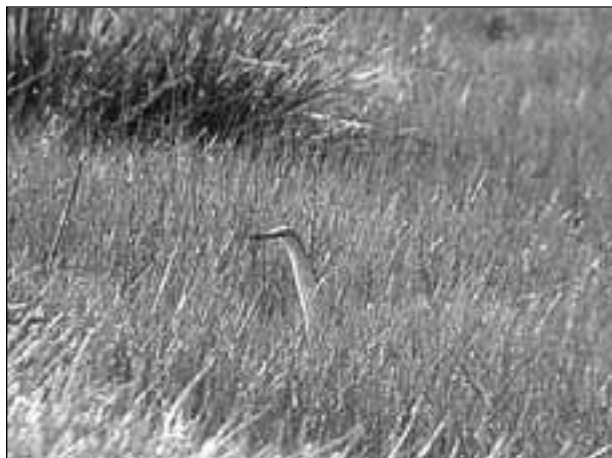
Garcilla cangrejera ( Ardeola ralloides ) junto al río Perales (Villamantilla) el 25 de mayo de 2008.