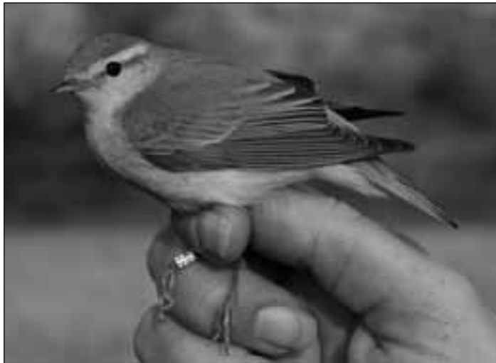
Mosquitero silbador ( Phylloscopus sibilatrix ) capturado para anillamiento en Nuevo Baztán el 21 de junio de 2008.