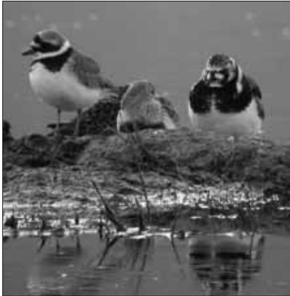
Vuelvepiedras común ( Arenaria interpres ) junto a un chorlito grande ( Charadrius hiaticula ) y dos correlimos comunes ( Calidris alpina ) en el embalse de Santillana (Manzanares el Real) el 14 de mayo de 2007 (foto: Daniel Díaz Díaz).