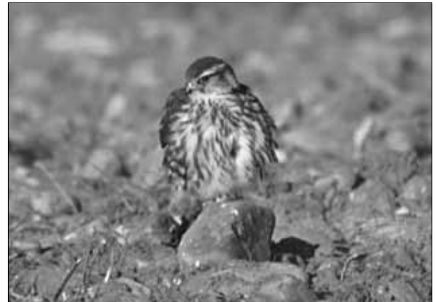
Esmerejón ( Falco columbarius ) en Aranjuez el 15 de noviembre de 2006 (foto: Carlos Ponce/SEO-Monticola).

- Aranjuez, 1 ind. el 15.XI.2006 (C. Ponce/SEO-Monticola).