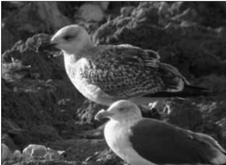
Gavión atlántico ( Larus marinus ) de primer invierno en el vertedero de Colmenar Viejo el 9 de noviembre de 2008.

- Colmenar Viejo, vertedero de residuos sólidos urbanos: