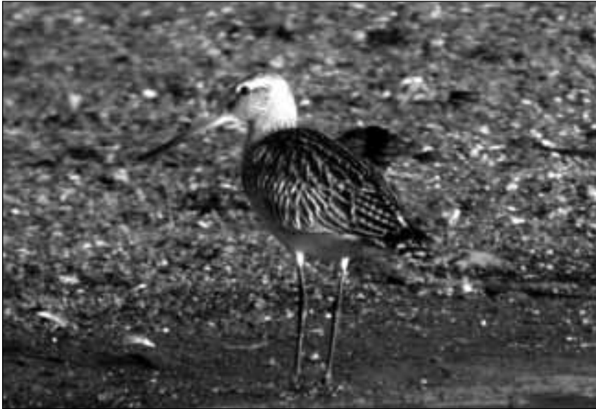
Aguja colipinta ( Limosa lapponica ) en el embalse de Santillana (Manzanares el Real) el 12 de octubre de 2007 (foto: José Antonio Matesanz).