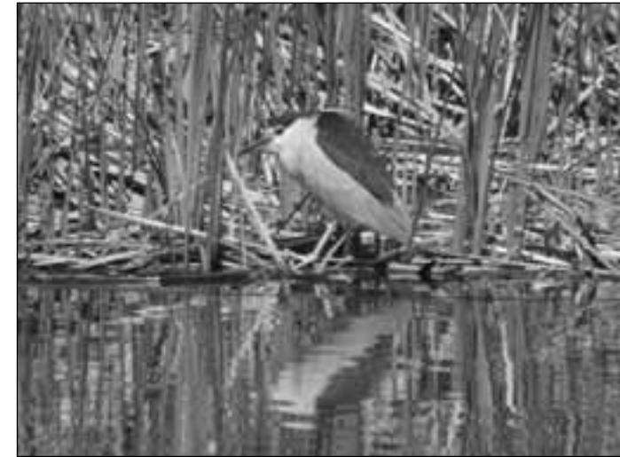
Martinete común ( Nycticorax nycticorax ) en el lago del campo de golf de la urbanización El Bosque (Villaviciosa de Odón) el 22 de abril de 2007.

- Guadalix de la Sierra, embalse de Pedrezuela, 3 ind. volando al anochecer el 12.VIII (A. H. Ortega Morejón y D. Díaz Díaz).