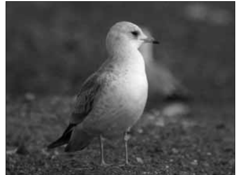
Gaviota cana ( Larus canus ) de primer invierno en el vertedero de Pinto el 21 de enero de 2007 y el 30 de noviembre de 2008.