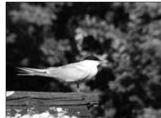
Charrán común ( Sterna hirundo ) en el río Manzanares (Madrid) el 25 de abril de 2008.

- Madrid, río Manzanares, puente de los Franceses: 1 ind., posado en el tejadillo de una caseta para patos, junto con una gaviota reidora el 25.IV (J. Risueño y R. Velasco); y el mismo ej. entre el puente de los Franceses y el puente de la Reina, vuela y pesca en el río, perseguido en una ocasión por una gaviota reidora y en otra por una urraca el 26.IV (M. Álvarez).