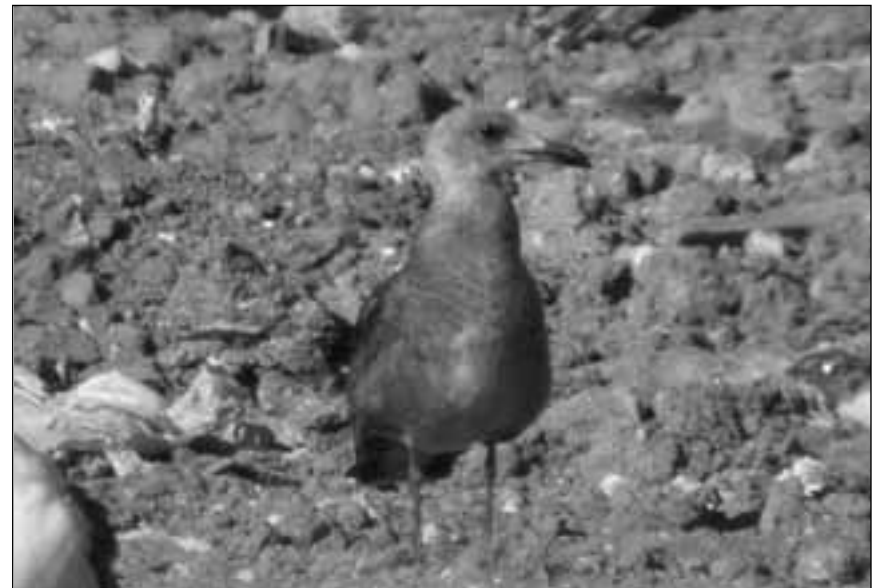
Gaviota de Audouin ( Larus audouinii ) de tercer verano en el vertedero de Pinto el 13 de abril de 2008 y ejemplar juvenil en el vertedero de Colmenar Viejo el 7 de septiembre de 2008.