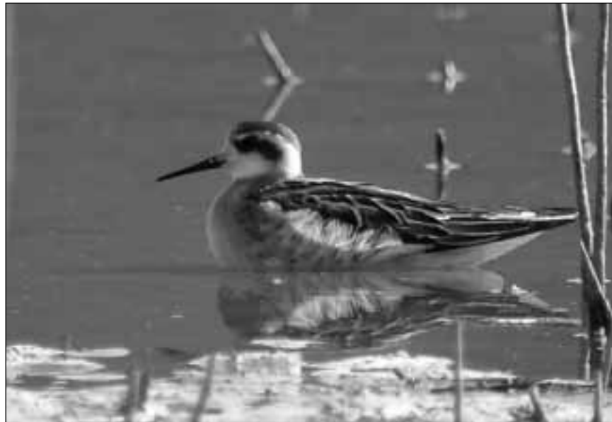
Falaropo picofino ( Phalaropus lobatus ) joven en el embalse de Pedrezuela (Guadalix de la Sierra) el 7 de septiembre de 2007 y el 11 de septiembre de 2007.