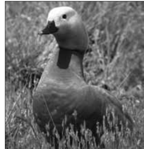
Tarro canelo ( Tadorna ferruginea ) en el embalse de Santillana (Manzanares el Real) el 14 de mayo de 2007.