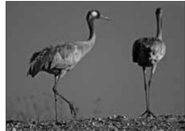
Grullas comunes ( Grus grus ) en la orilla del embalse de Santillana (Manzanares el Real) el 18 de octubre de 2007 y en un barbecho de Torrejón de Velasco el 22 de febrero de 2008.