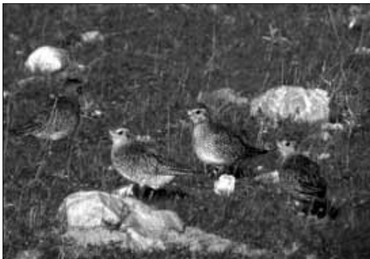
Chorlitos dorados europeos ( Pluvialis apricaria ) en Colmenar Viejo el 8 de marzo de 2007.