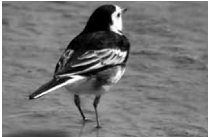
Lavandera blanca enlutada ( Motacilla alba yarrellii ) observada en el vertedero de Colmenar Viejo el 26 de octubre de 2008.