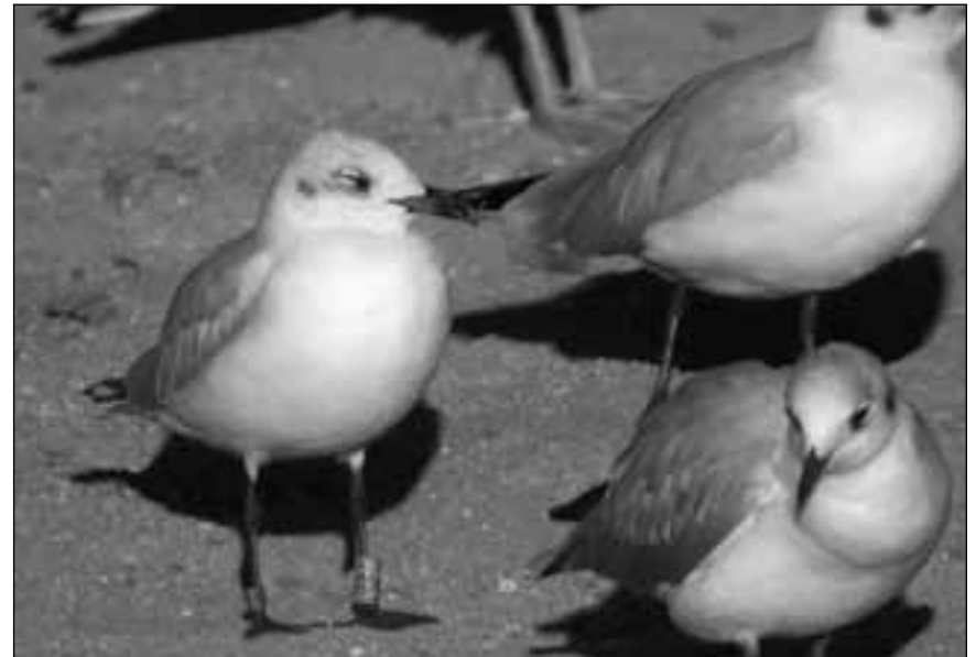
Gaviota cabecinegra ( Larus melanocephalus ) adulta en plumaje nupcial en el vertedero de Pinto el 11 de febrero de 2007 y ejemplar de segundo invierno con anilla observado en el vertedero de Colmenar Viejo el 14 de septiembre de 2008.