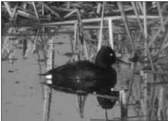
Porrón pardo ( Aythya nyroca ) observado en la laguna artificial Soto Mozanaque (Algete) el 9 de febrero de 2008.