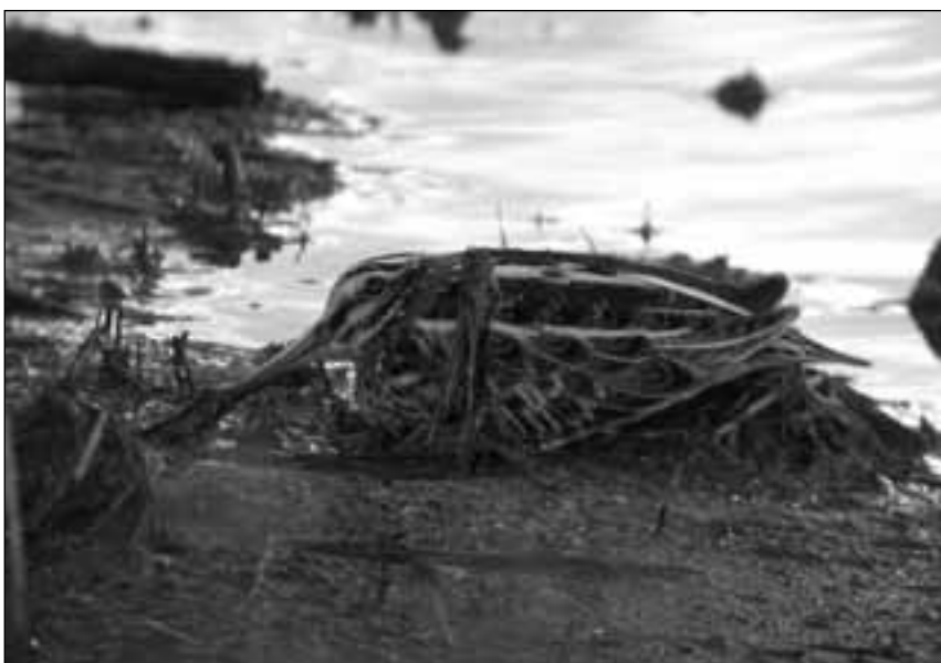
Agachadiza chica ( Lymnocyptes minimus ) joven capturada para anillamiento en la ribera del río Manzanares (Manzanares el Real) el 18 de noviembre de 2007 y ejemplar en el embalse de Pedrezuela (Guadalix de la Sierra) el 5 de diciembre de 2008.

- Madrid, parque Juan Carlos I, primera observación en la zona, 1 ej. oculto entre griñolera ( Cotoneaster sp.) el 15.XII (M. Llanos Neila). No estaba citado como invernante en la cuadrícula 63 (VK47).