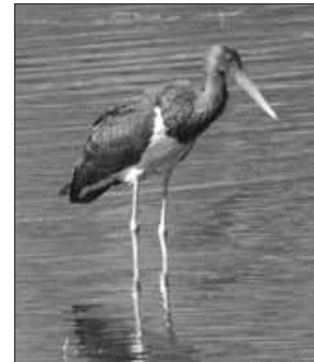
Cigüeña negra ( Ciconia nigra ) joven en el embalse de Santillana (Manzanares el Real) el 10 de octubre de 2007.

- Resultados obtenidos en el censo y seguimiento de la población reproductora madrileña en el año 2008: se localizan 8 territorios ocupados, en éstos 6 pp. inician la reproducción; finalmente sólo 3 pp. crían con éxito volando 5 pollos, por lo que se obtiene una productividad de 0,63, un éxito reproductor de 0,83 y una tasa de vuelo de