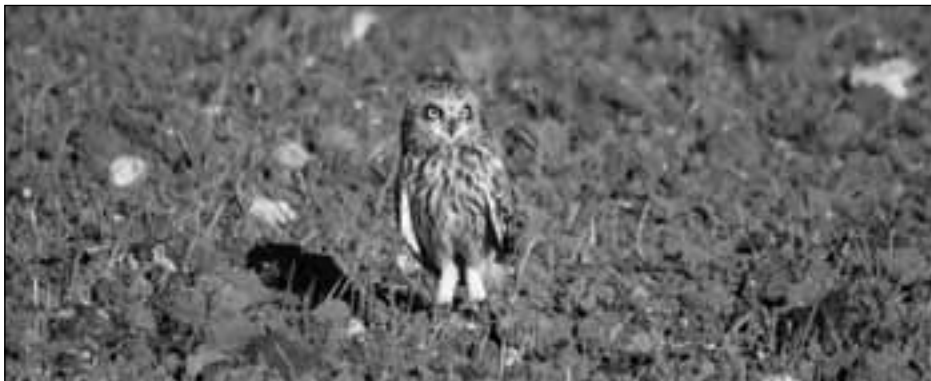
Búhos campestres ( Asio flammeus ) en Campo Real el 23 de enero de 2008 (fotos: Carlos Ponce/SEO-Monticola).

1 ej. capturado para anillamiento el 23.X (C. Ponce, Ó. Magaña y J. A. Calleja/SEO-Monticola).