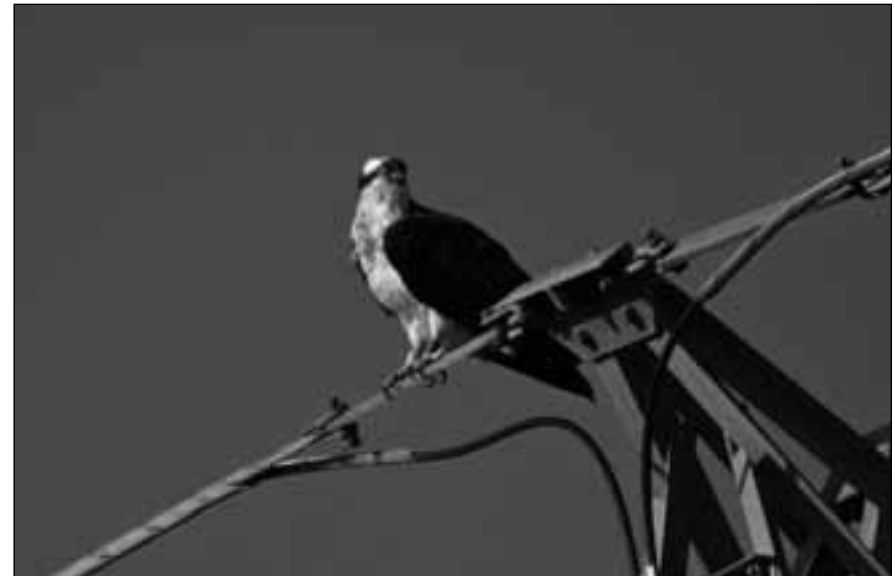
Águila pescadora ( Pandion haliaetus ) en las graveras de El Porcal el 21 de abril de 2007 y ejemplar marcado posado en una torreta en Aranjuez el 26 de septiembre de 2008.