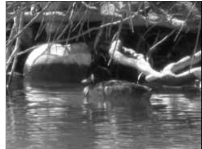
Porrón bastardo ( Aythya marila ) hembra en una de las graveras de El Porcal (Rivas-Vaciamadrid) el 25 de marzo de 2007.