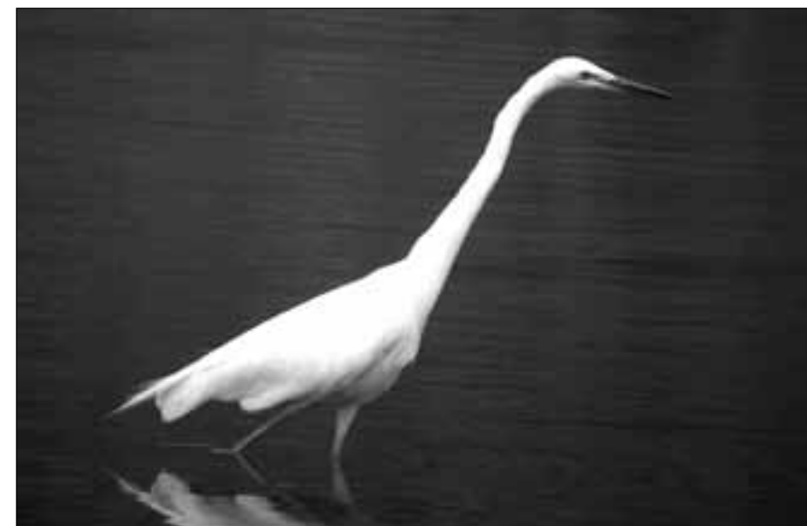
Garceta grande ( Egretta alba ) adulta en plumaje nupcial en las graveras de El Porcal (Rivas-Vaciamadrid) el 25 de marzo de 2007 y otro ejemplar también en plumaje nupcial en el embalse de Santillana (Manzanares el Real) el 11 de abril de 2008.