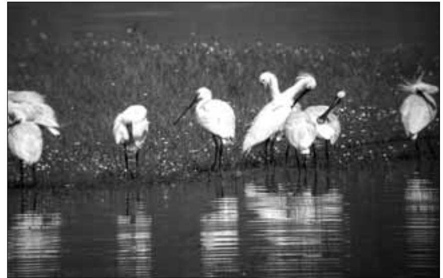
Espátulas comunes ( Platalea leucorodia ) en las graveras de El Porcal (Rivas-Vaciamadrid) el 23 de junio de 2007 (foto superior: Carlos Ponce/SEO-Monticola) y grupo en el embalse de Santillana (Manzanares el Real) el 12 de junio de 2008 (foto inferior: Daniel Díaz Díaz).