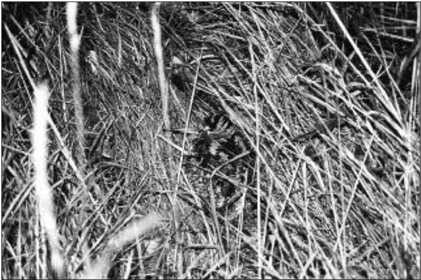
Chocha Perdiz recogida en el casco urbano de Madrid y liberado en la ribera del río Jarama junto a la Presa del Rey (Rivas-Vaciamadrid).

- San Martín de la Vega, río Jarama junto al puente de la M-506, 1 ave comiendo el 27.XII (F. Martín Martín).