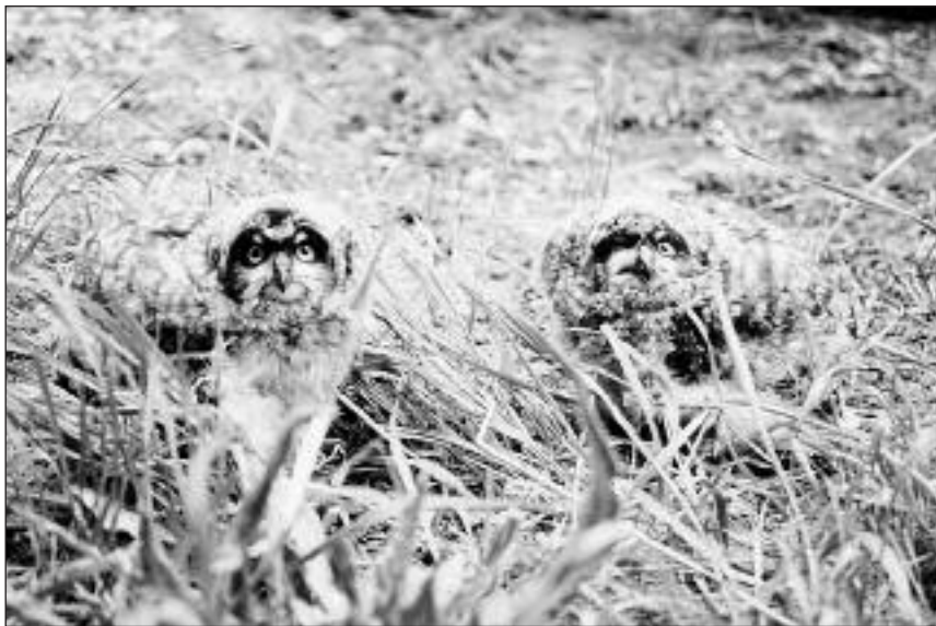
Pollos de Lechuzta Campesina localizados el 10 de abril en las cercanías del Carrizal de Villamejor (Aranjuez).