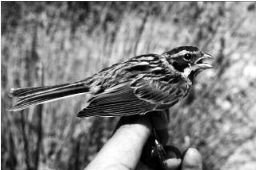
Escribano Palustre juvenil capturado en la Estación de Anillamiento de Las Minas (San Martín de la Vega) en julio.