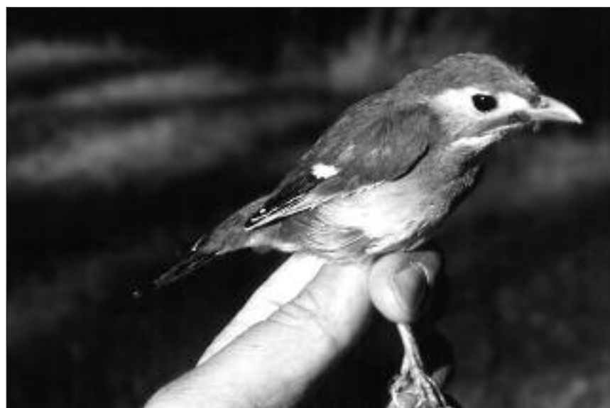
Ruisseñor de Japón capturado en junio en la estación de anillamiento de Barojas.