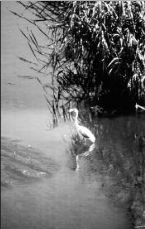
Flamenco ( Phoenicopterus ruber ) joven observada en el río Jarama (Aranjuez) en septiembre de 1998.