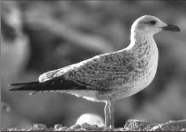
Gaviota patiamarilla ( Larus michahellis ) de primer invierno en el vertedero de Pinto el 18 de febrero.