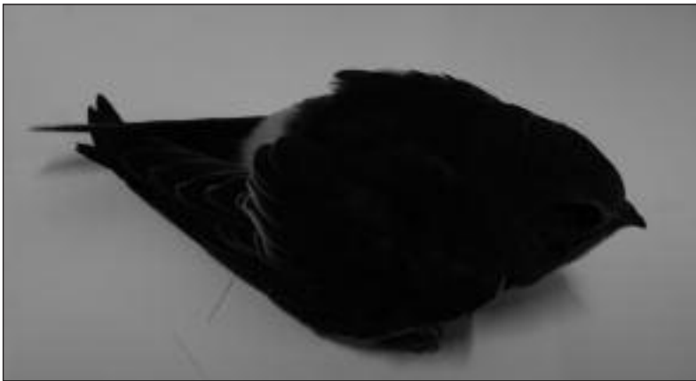
Vencejo cafre ( Apus caffer ) volantón recogido en Torrejón de Ardoz el 26 de octubre.