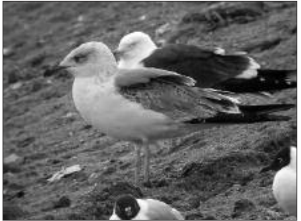
Gaviota patiamarilla ( Larus michahellis ) de segundo invierno en el vertedero de Colmenar Viejo el 5 de marzo.