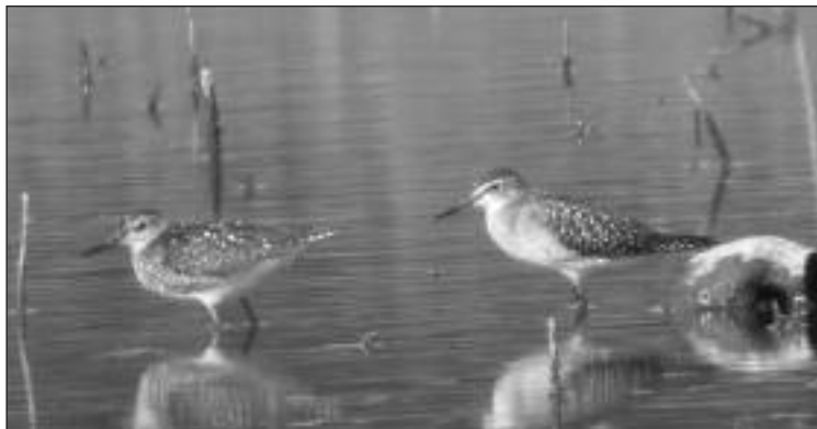
Andarríos bastardos ( Tringa glareola ) en el embalse de Pedrezuela (Guadalix de la Sierra) el 2 de agosto (foto: Daniel Díaz Díaz).