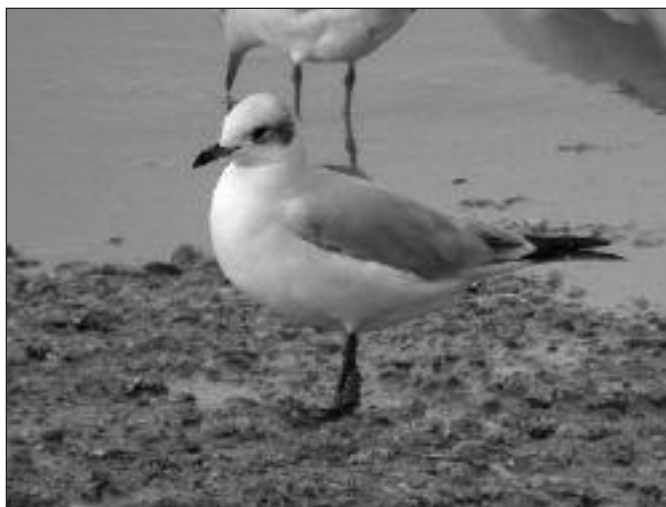
Gaviota cabecinegra ( Larus melanocephalus ) de primer invierno en el vertedero de Colmenar Viejo el 19 de noviembre.