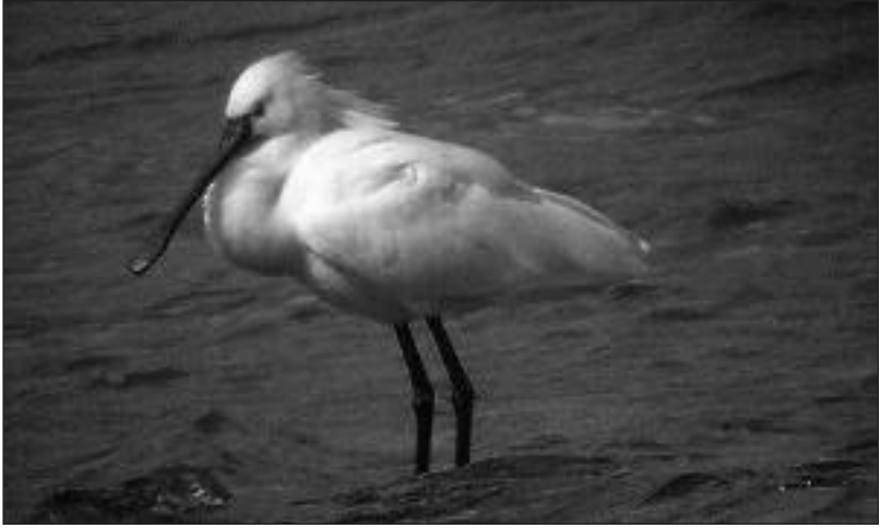
Espátula común ( Platalea leucorodia ) en las graveras de El Porcal (Rivas-Vaciamadrid) el 24 de marzo.