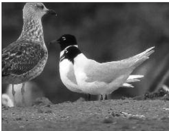
Gaviotas cabecinegras ( Larus melanocephalus ) adultas en el vertedero de Pinto el 19 de marzo.