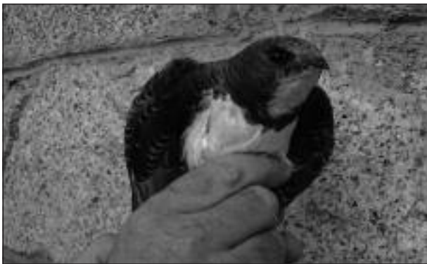
Vencejo real ( Apus melba ) adulto recogido en Cuatro Vientos el 27 de octubre (foto: Patricia Orejas/Brinzal).