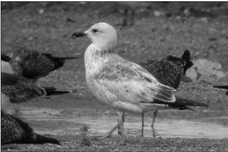
Gaviota cáspica ( Larus cachinnans ) de primer invierno en el vertedero de Pinto el 20 de marzo.

- Rivas-Vaciamadrid, graveras de El Porcal, balsas centrales, 1 ej. el 15.VI (J. Marchamalo/SEO-Monticola).