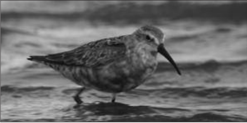
Correlimos zarapitín ( Calidris ferruginea ) adulto en el embalse de Pedrezuela (Guadalix de la Sierra) el 16 de agosto.

Criterio: todas las citas recibidas. Sin citas recibidas.