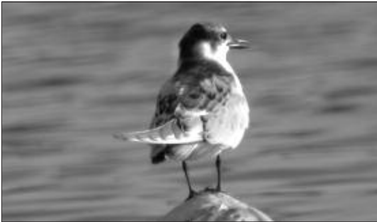
Fumarel cariblanco ( Chlidonias hybrida ) joven en el embalse de Pedrezuela (Guadalix de la Sierra) el 5 de septiembre.