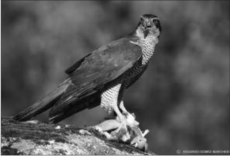
Azor común ( Accipiter gentilis ) con una paloma recién capturada en Valdemorillo el 8 de junio.

la población reproductora madrileña en el año 2006: se localizan 27 pp., inician la reproducción 22 pp. y sacan adelante 26 pollos (Consejería de Medio Ambiente y Ordenación del Territorio de la Comunidad de Madrid).