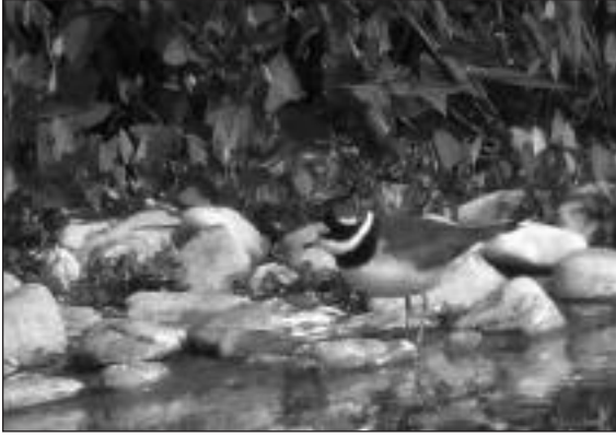
Chorlitoje grande ( Charadrius hiaticula ) en las graveras de El Porcal (Rivas-Vaciamadrid) el 10 de mayo.