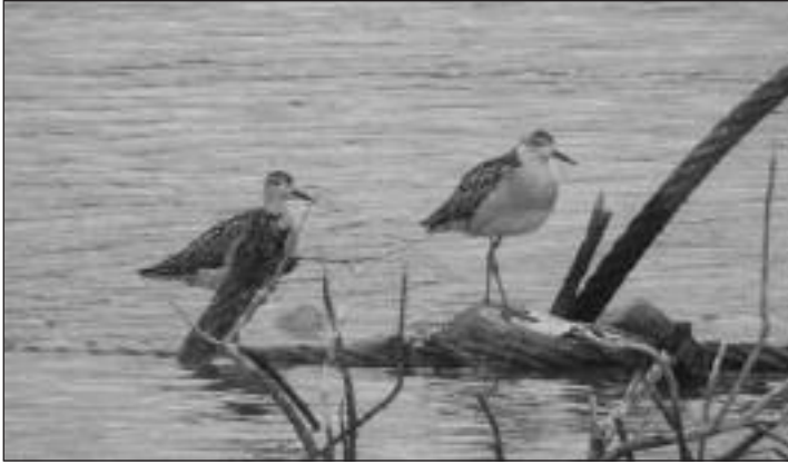
Combatientes ( Philomachus pugnax ) jóvenes en una gravera de Velilla de San Antonio el 22 de octubre.