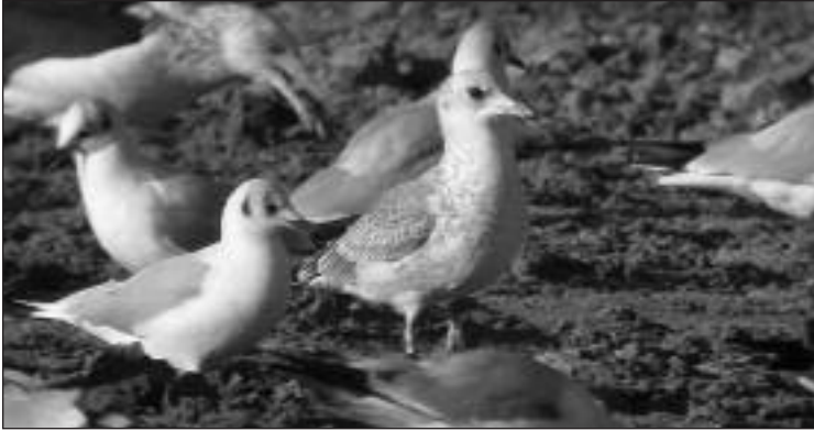
Gaviota cana ( Larus canus ) de primer invierno junto a varias gaviotas reidoras y una gaviota sombría en el vertedero de Pinto el 29 de diciembre (foto: Delfin González).

(J. Marchamalo/SEO-Monticola); 1 ind. de primer invierno el 29.XII (D. González, J. M. Ruiz, J. Marchamalo y M. Juan/SEO-Monticola).