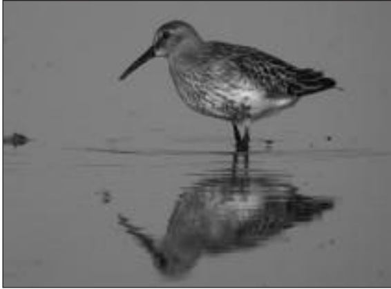
Correlimos común ( Calidris alpina ) joven en el embalse de Pedrezuela (Guadalix de la Sierra) el 5 de septiembre.

aves (2 en plumaje de invierno y 1 mudando) el 11.III (G. Martín García/SEO-Sierra de Guadarrama); 1 ad. en plumaje nupcial el 5.VIII y 1 jov. el 26.VIII (J. M. Ruiz); 1 jov. junto a otros limícolas el 28.VIII y al menos 4 jov. el 5.IX (D. Díaz Díaz); 3 jov. el 2.IX y el 17.IX (G. Martín García/SEO-Sierra de Guadarrama).