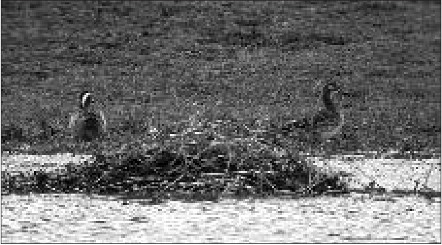
Pareja de cercetas carretonas ( Anas querquedula ) en la orilla del embalse de Pedrezuela (Guadalix de la Sierra) el 19 de marzo (foto: Gabriel Martín García/SEO-Sierra de Guadarrama).

- San Martín de la Vega, gravera Soto Pajares, 4 m. el 12.III (F. Martín, M. Juan/SEO-Monticola y D. Llorente).