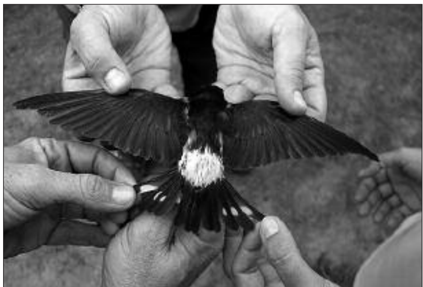
Híbrido de golondrina común y avión común ( Hirundo rustica x Delichon urbica ) capturado para anillamiento en el Caserío del Henares (San Fernando de Henares) el 21 de septiembre.