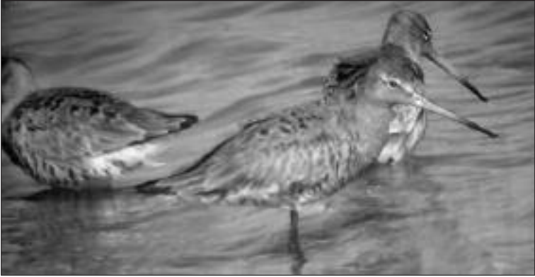
Agujas colinegras ( Limosa limosa ) en las graveras de El Porcal (Rivas-Vaciamadrid) el 23 de marzo (foto: Javier Marchamalo/SEO-Monticola).