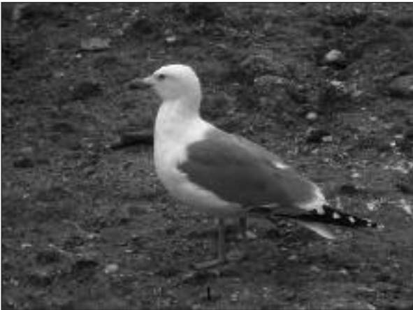
Gaviota patiamarilla ( Larus michahellis ) adulta en el vertedero de Colmenar Viejo el 31 de diciembre.