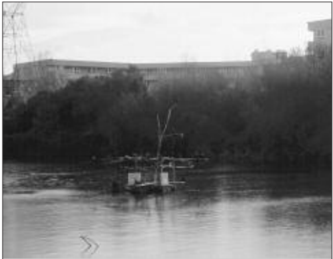
Dormitorio de Cormorán Grande en el embalse de Molino de la Hoz, febrero de 2001