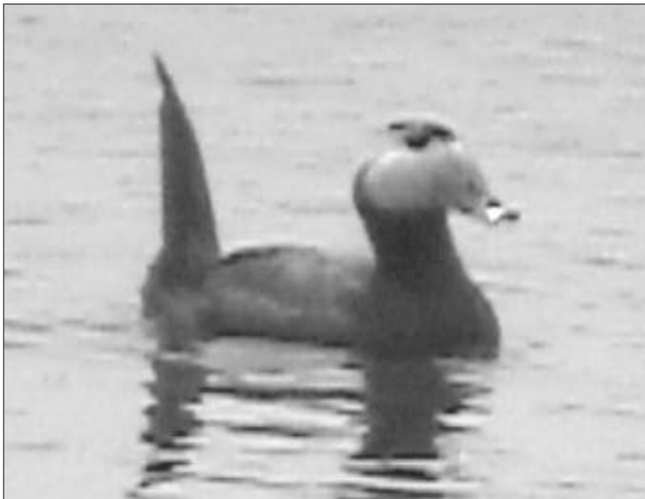
Malvasía Cabeciblanca ( Oxyura leucocephala ) en una gravera de El Porcal el 10 de noviembre (foto: D. González).

por encima de los cortados el 1.III (F. Martín Martín).