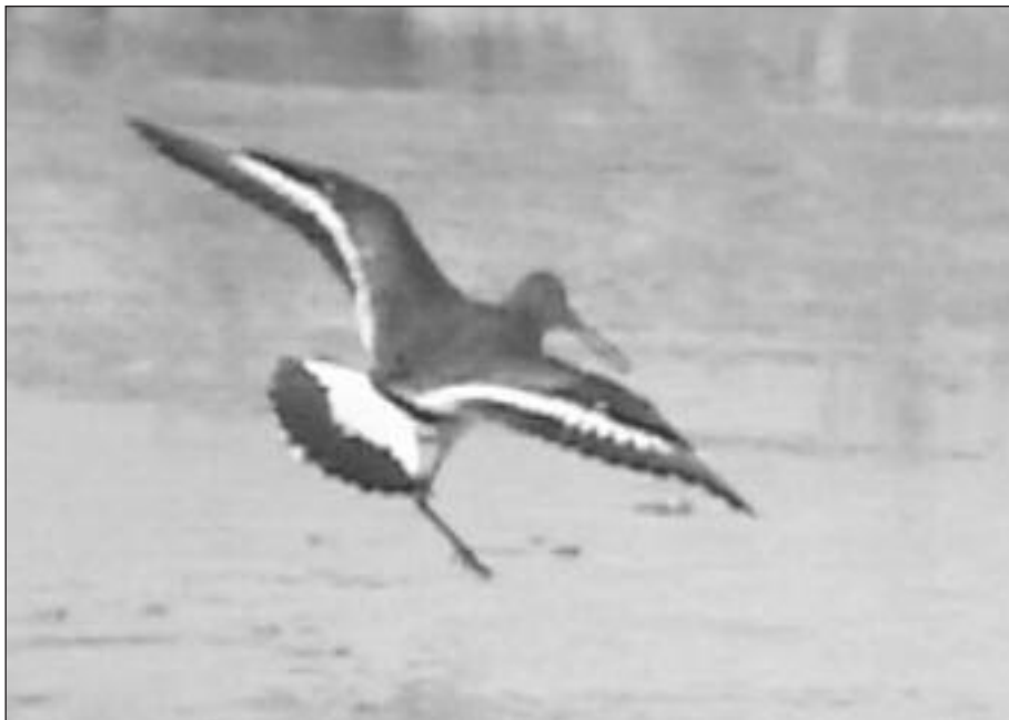
Aguja Colinegra ( Limosa limosa ) en una gravera de Velilla de San Antonio el 26 de marzo.