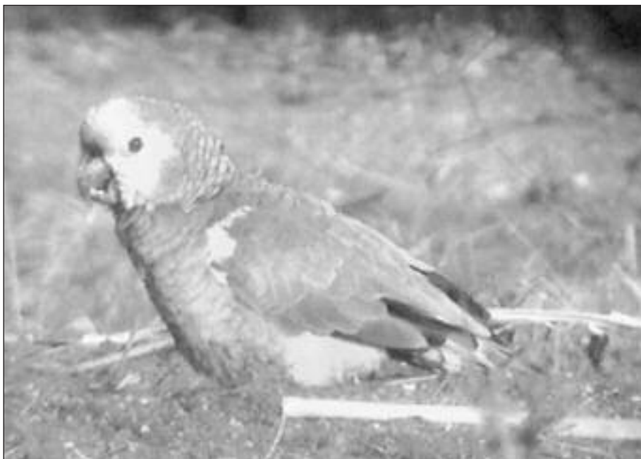
Amazona Frentiazul ( Amazona aestiva ) en la finca experimental La Poveda el 26 de noviembre.

Estatus provincial : A escapada de cautividad.