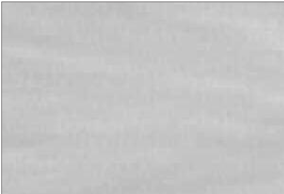
Zampullín Cuellinegro ( Podiceps nigricollis ) en la laguna artificial Soto Mozanaque el 13 de abril.