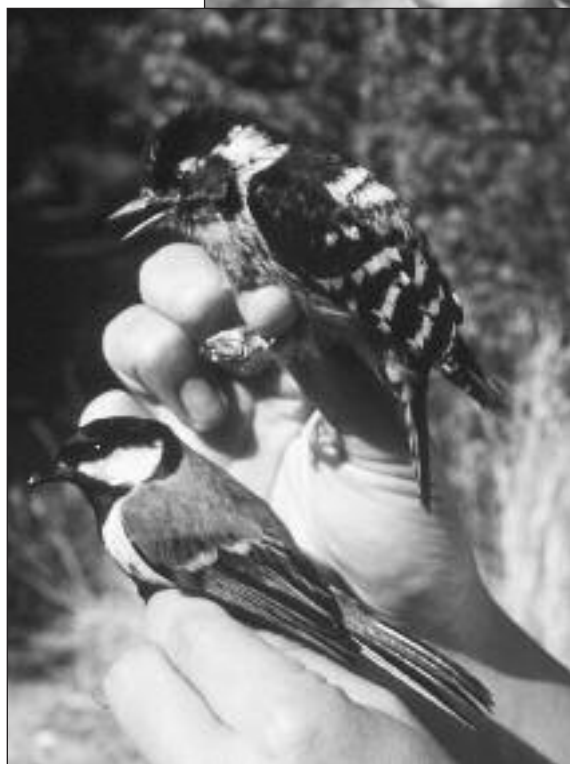
Hembra adulta de Pico Menor ( Dendrocopos minor ) capturado en La Herrería y comparación con un Carbonero Común.