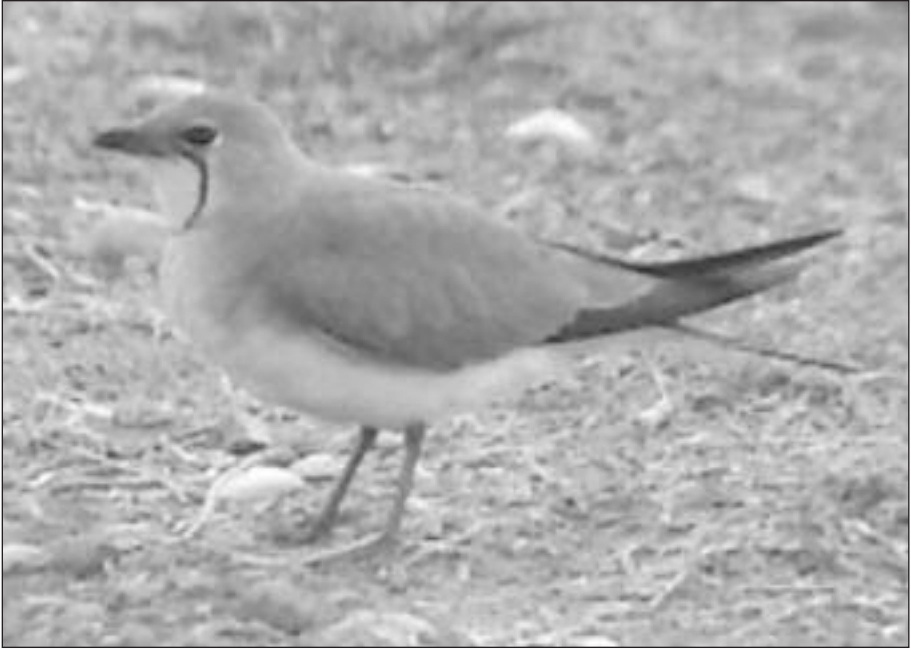
Canastera Común ( Glareola pratincola ) en la laguna artificial Soto Mozanaque el 9 de mayo (foto: D. González).