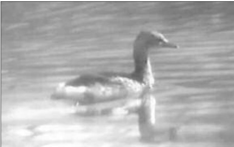
Zampullín Cuellirrojo ( Podiceps auritus ) en una gravera de Velilla de San Antonio el 27 de febrero.

- Rivas-Vaciamadrid, graveras de El Porcal, censo completo de 30 ind. el 13.XII (G. Martín García).