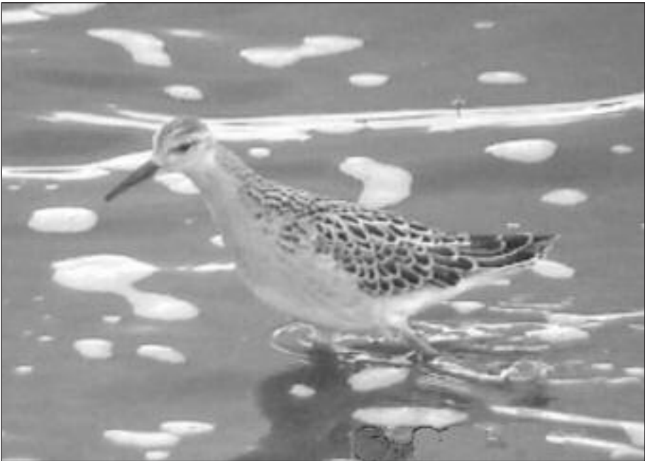
Combattente ( Philomachus pugnax ) en una gravera de Velilla de San Antonio el 26 de marzo.

- La Acebeda, arroyo Santo Domingo, 1 ej. el 29.II (Ó.