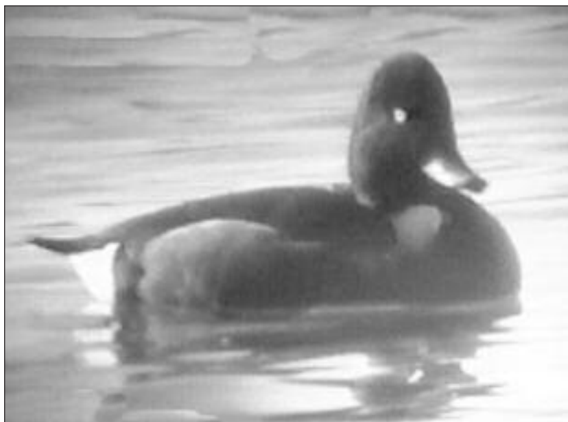
Macho de Porrón Pardo ( Aythya nyroca ) en una gravera de El Porcal el 10 de octubre.