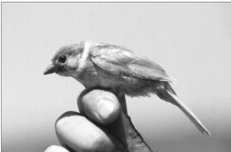
Gorrion Molinero ( Passer montanus ) leucístico capturado en la Estación de Anillamiento de Las Minas el 24 de junio (foto: J. Gamonal).

- Braojos de la Sierra, grupo de 6 aves el 13.V, varias aves en un bando de piquituertos el 20.V y 1 h. o inm. el 31.V (M.Á. Sánchez Martín).